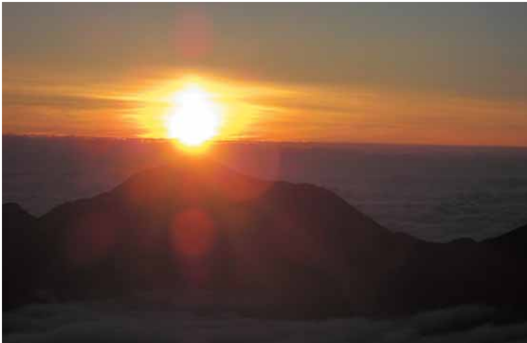
陽、常念に昇る