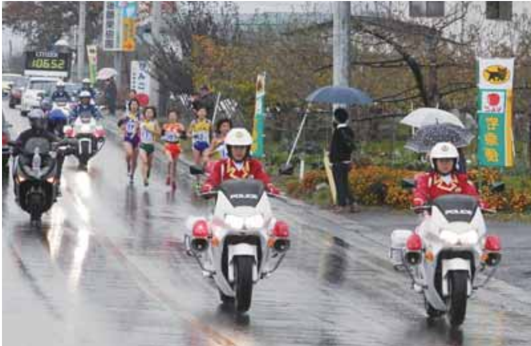
東日本女子駅伝