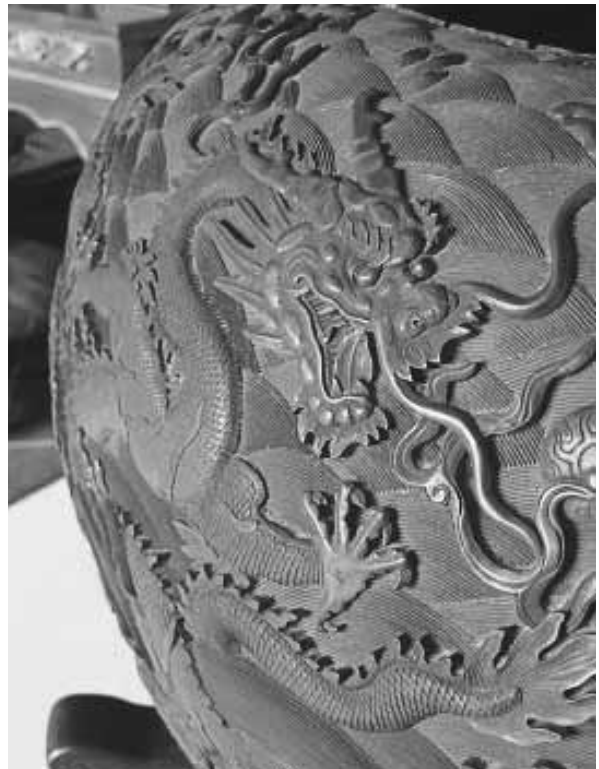
4本爪の龍が彫られた堆朱の甕

鳥越苦勞かもしれないが、復元テーマパーク会津藩校日新館内部には山東省曲阜市の孔子廟大正殿を模したものが存在し、建物全体が中華風仕立てで、およそ会津藩士の子弟がこの時代に孔子とともに寝起きしていたなど、会津人でも「知らぬが仏」では