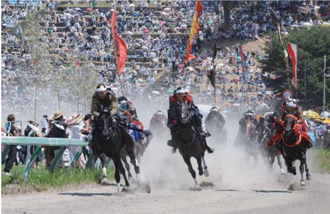
甲冑競馬